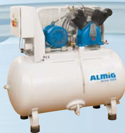
HL sur réservoir