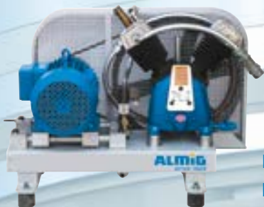
Booster sur plaque de base