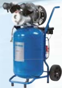
AT 6002 AT 7002