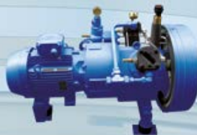
Booster sur base métallocaoutchoutée