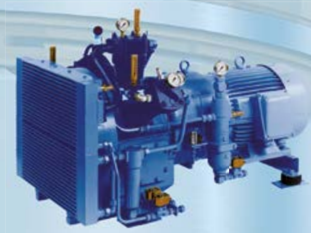
HLD sur logement métallocaoutchouté

Grâce à leur principe modulaire bien mûri, les séries offrent toutes les possibilités d'exploitation jusqu'à 40 bars, même dans les conditions industrielles les plus sévères.