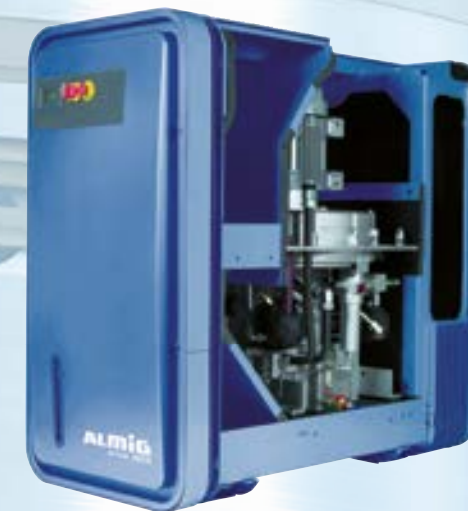
HP, en boîtier insonorisant standard